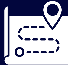
Navigation module 네비게이션 모듈