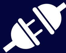
API interface API 인터페이스